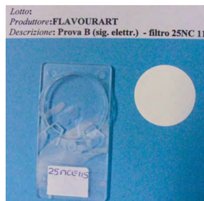
Fig. 4: Membrana in PTFE al termine della sessione di fumo elettronico. / PTFE membrane at the end of the e-cigarette session.

CO (Monossido di Carbonio) [12] Il monossido di carbonio non ha mostrato alcuna variazione con il fumo elettronico, rimanendo al di sotto dei limiti di rilevabilità dello strumento, mentre il fumo di sigaretta ha prodotto un costante incremento della sua concentrazione durante tutta la durata del campionamento, raggiungendo un picco di 11 mg/m 3 , valore questo, al di sopra della soglia di legge (10 mg/m 3 ) 5 (Fig. 5).