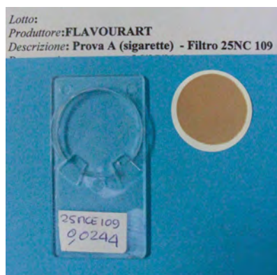
Fig. 3: Membrana in PTFE al termine della sessione di fumo tradizionale. / PTFE membrane at the end of the cigarette smoking session.

branes at the end of the sessions. Even if this does not constitute analytic data as such, it has given us an idea of the results that we could expect (Fig. 3 and 4).